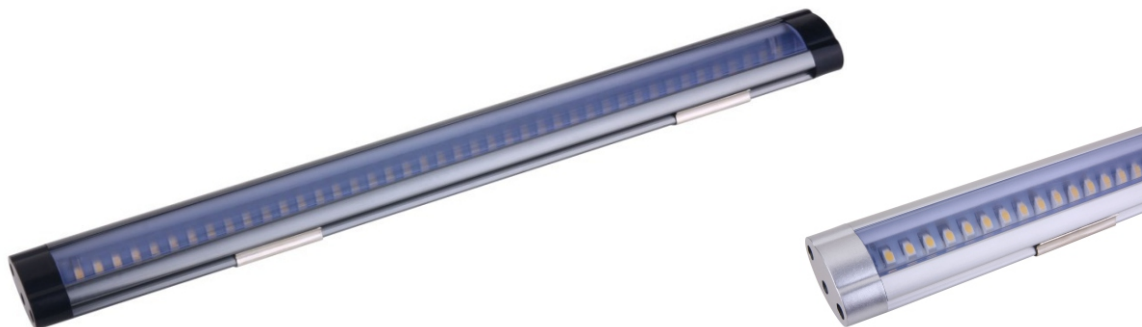
LLC28, 230VAC (12 VDC)