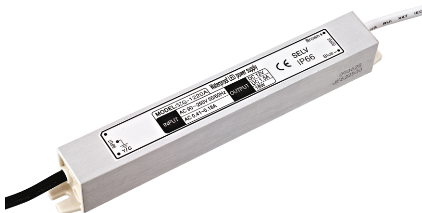
Alimentation type SPV12 230VAC/12VDC (1.5A)